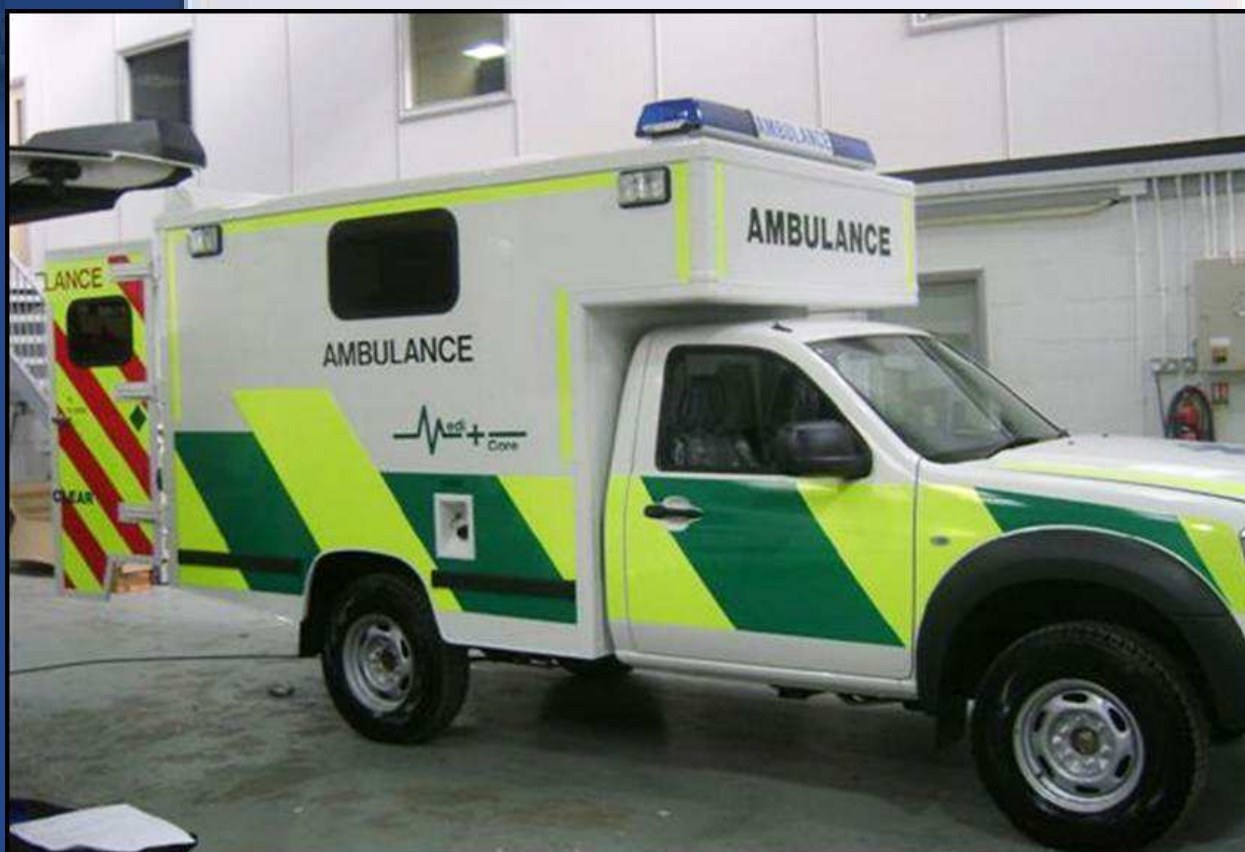
Véhicule Ambulance 4X4 NISSAN NAVARA King Cab XE

SAS ACHATS PUBLICS DE LA SEINE-SAINT-DENIS - DÉPARTEMENT 932 000 0000 - APE 2902Z - TVA INTRACOMMUNALE 411 810004